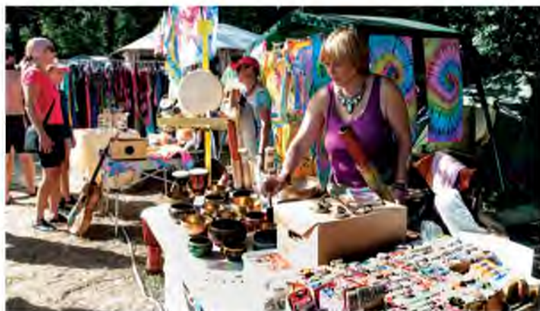
По традиции развернул свои торговые ряды Грушинский Арбат. Здесь можно купить всё – от редкого советского значка до моторной лодки