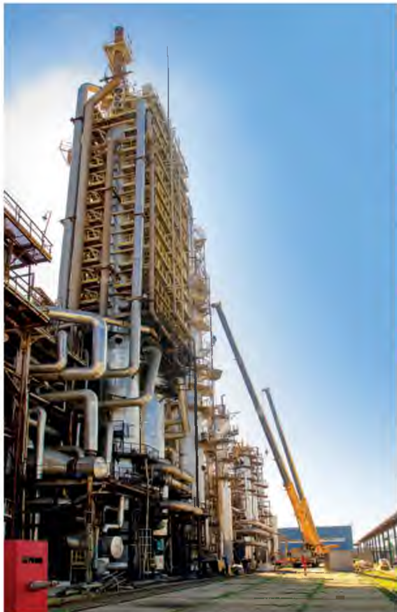
Идёт замена антикоррозийного покрытия внутренних поверхностей абсорбера