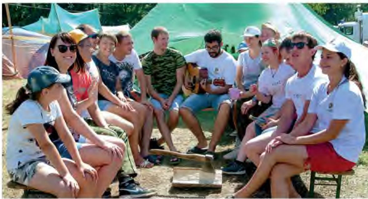
В этом году Тольяттиазот уже в пятый раз развернул свои флаги и лагерь на главной поляне

По официальным данным, слет посетили свыше 27000 гостей, не считая служб, которые работали на фестивале. Для участников в этом году работали 15 площадок, каждая со своей тематикой, историей и традициями: «Главная эстрада», «Детская», площадка «Победа», «Междуречь», «Квартира», «Кольский бугорок», «Пилигримы», «Степной ветер», «Зазеркалье», «Чайхана», «Время колокольчиков», «Открытие», «Азия+», «Спортивная», «Площадка прослушивания». По традиции с историей Валерия Грушина можно было познако-