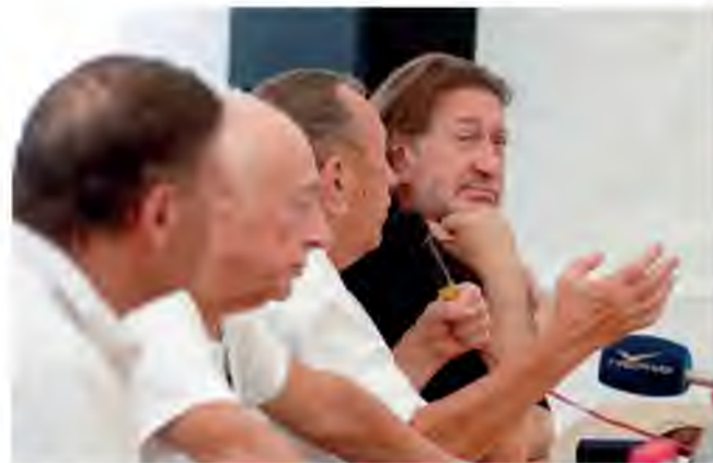
В Грушинском фестивале приняли участие и начинающие исполнители, и звёзды бардовской песни