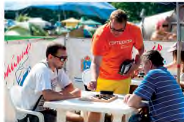
Команда Тольяттиазота показала себя в разных видах спортивных соревнований